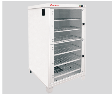
Расстойный шкаф ШРЭ-2.1